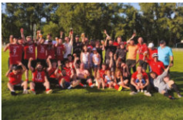
La joie et la fierté après le sacre — FC Rosenau 1946 champion !

La montée en D4 est aussi leur victoire.