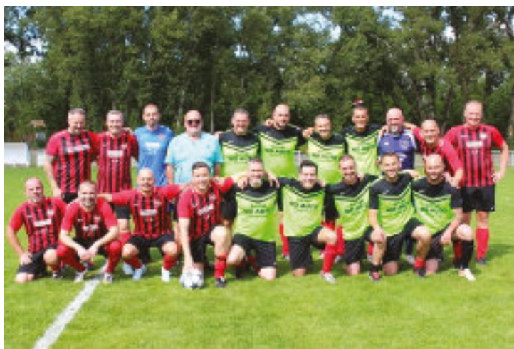
Les vieilles gloires du FC Rosenau, fiers de rechausser les crampons

Quatre-vingts ans d'histoire, c'est des centaines de joueurs formés, des générations d'éducateurs dévoués, des bénévoles de l'ombre qui font tourner la machine semaine après semaine, et des familles qui font confiance au club depuis des décennies. Cet anniversaire était leur fête à tous.