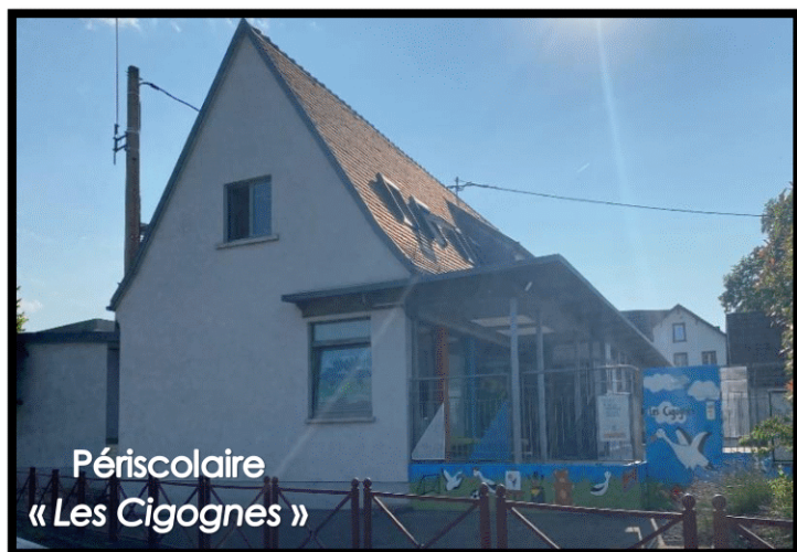
Périscolaire « Les Cigognes »

La vocation première de notre Pôle Enfance Jeunesse était de permettre aux enfants et aux adolescents d'accéder à des activités qui correspondent à leurs besoins et en fonction de leurs tranches d'âges.