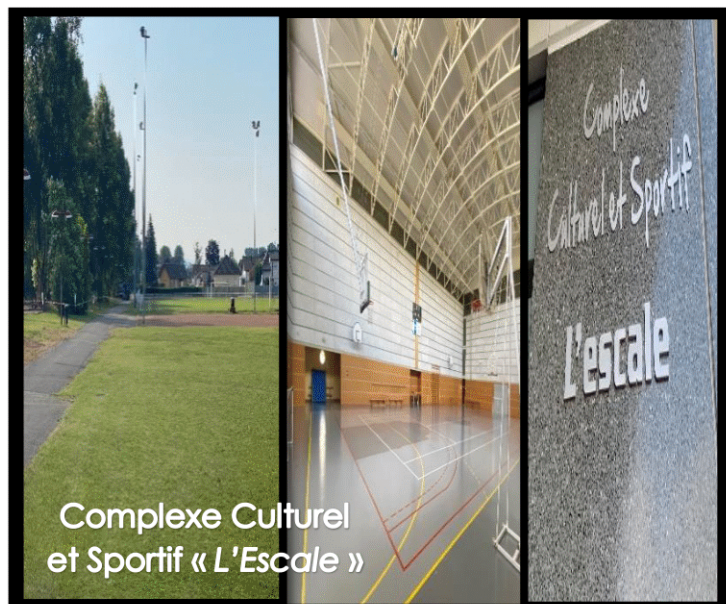
Complexe Culturel et Sportif « L'Escal »