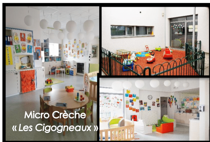
Micro Crèche « Les Cigogneaux »

Retrouvez-nous le mois prochain pour évoquer les actions relatives à la Culture et aux Séniors.