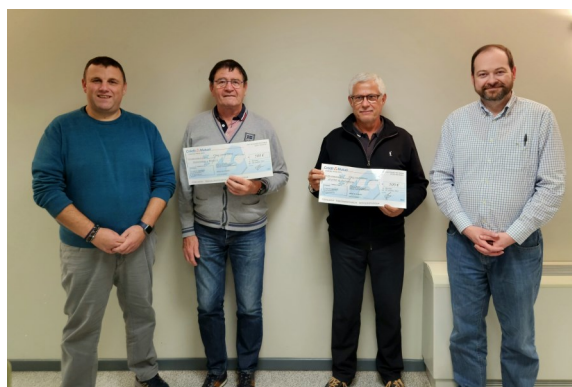
De gauche à droite sur la photo :