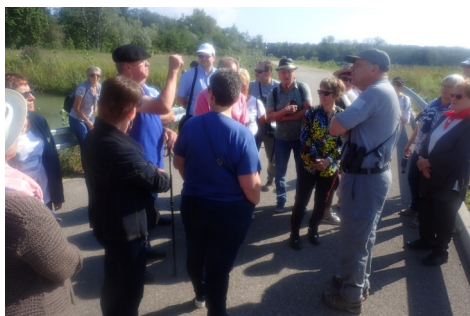
Visite guidée de la partie « renaturée » de l'Île du Rhin