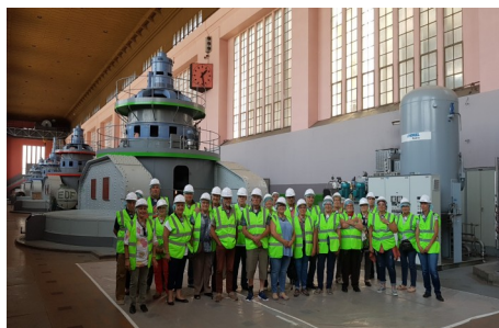
Visite guidée de la Centrale Hydroélectrique de Kembs - Rosenau