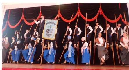
Journée officielle organisée par l'Association haut-rhinoise des Amis des Landes

En attendant ces futures rencontres, nous vous proposons de revenir en photos sur ce séjour.