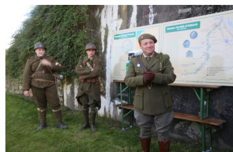
Visite guidée de la Casemate de Uffheim