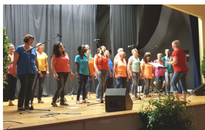
Les Gospel Messenger's