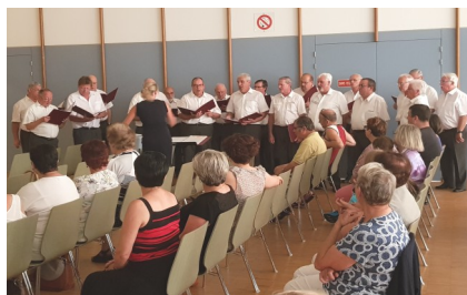
Le Chœur d'Hommes du Rhin