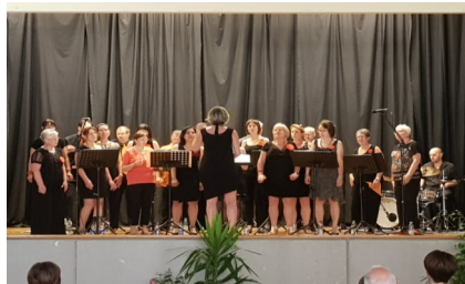
Le Manatthan Jazz Choir