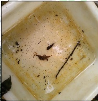
↑ Fond de bassin présentant près de 200 larves de moustiques ← Gîte larvaire en cours de traitement

Ce scénario semble se répéter avec des pluies orageuses qui ont plutôt épargné le secteur des 3 frontières ainsi que le Bassin potassique.